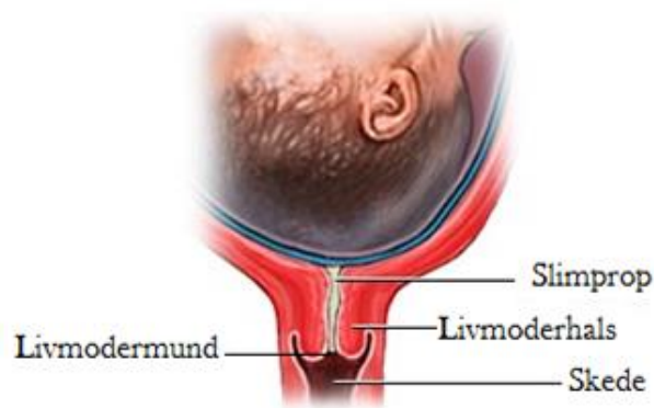
Umoden, lang livmoderhals og lukket livmodermund.

Når fødslen nærmer sig, vil livmoderhalsen blive kortere og blødere (den modnes), og livmodermunden vil begynde at åbne sig lidt. Når vi beslutter, hvordan fødslen bedst kan sættes i gang, vil vi derfor vurdere livmoderhalsens modenhed, og hvor åben livmodermunden er.